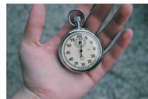
ZEITDRUCK IM FAMILIENALLTAG 30. Juni 2021

Auf der Unterseite „ Tipps für Familien “ findet ihr eine bunte Vielfalt unterschiedlichster Inhalte und Beiträge, die für junge Familien interessant sein können. Hier stelle ich nach und nach z.B. die Zusammenfassungen der Thematischen Elterntreffpunkte , aber auch Impulse zu anderen Themen , den aktuellen Familien-Newsletter und demnächst auch eine Zusammenstellung von Anlaufstellen und Anbietern in Durlach und Umgebung ein. Darum: Immer mal wieder reinschauen, was Neues dazugekommen ist: