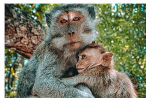
FREMDELN, KLAMMERN, TRENNUNGSANGST 1. Juli 2021