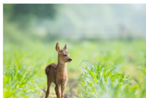
WAS BRAUCHEN SCHÜCHTERNE KINDER? 7. Juli 2021